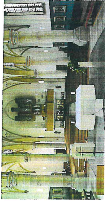
St. Jakobus Glane

Die Glaner und die Bad Iburger Pfarrcaritas sind eingebunden in den Deutschen Caritasverband. Dieser hat sich zum Ziel gesetzt, Nächstenliebe und Wohltätigkeit zu fördern und allen Mitmenschen mit Hochachtung zu begegnen.